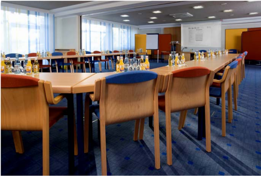
Seminarraum mit Ausstattung von Neuland