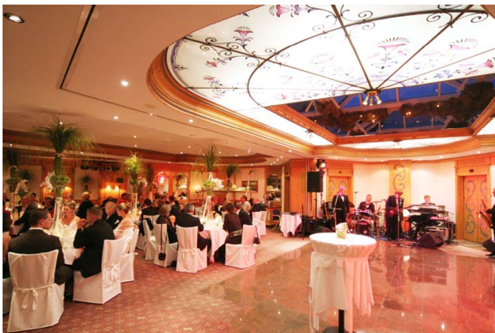
Stilvolles Ambiente - Unsere Bankettraume - fur jeden Anlass und jedes Fest

Wir unterbreiten Ihnen gerne individuelle Angebote und Programmvorschlage fur Ihre ganz personliche Feier. Ob Sie eine Weihnachtsfeier, ein Firmenjubilaum oder sonstige Veranstaltung planen - uberzeugen Sie sich von unserer Kreativitat und Qualitat. Heie Rythmen, kurzweilige Shows - unsere Fantasie fur Ihr Programm kennt keine Grenzen