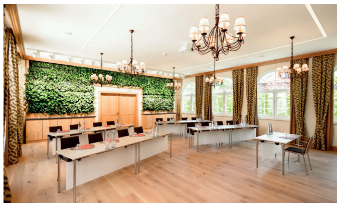
Grüner Salon 76 m 2