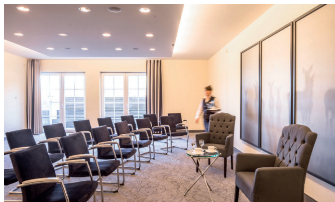
Silberkopf 75 m 2