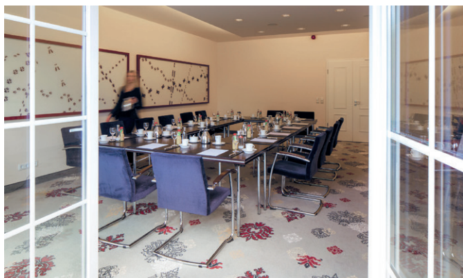
Josephshöhe 55 m 2