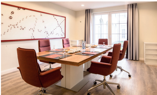
Haselhöhe 25 m 2