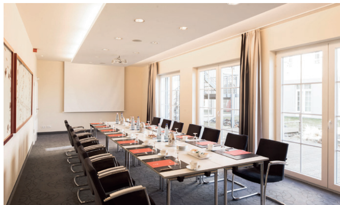
Nesselberg 45 m 2