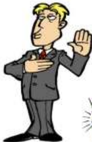
Der treue Firmenchef